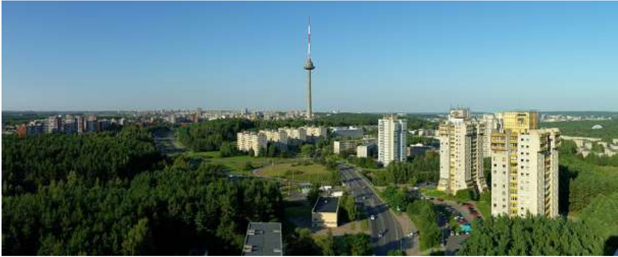
The freedom of Lithuania